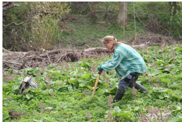
Brug handsker og kraftigt tøj, der dækker huden.

rodstikning, hvor planten skæres over ca. 10 cm under jordoverfladen med f.eks. en velsleben havespade eller dræns spade. Jo tidligere på året og jo mindre planten er, jo nemmere er det.